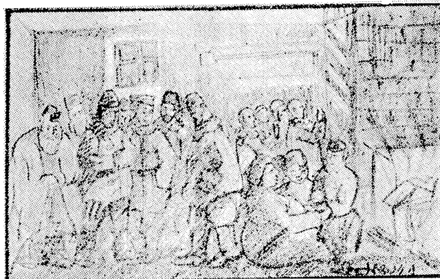
...און סיגייט-אויפק א דאווענן צו גאט... 2טער טייל, ז' 195